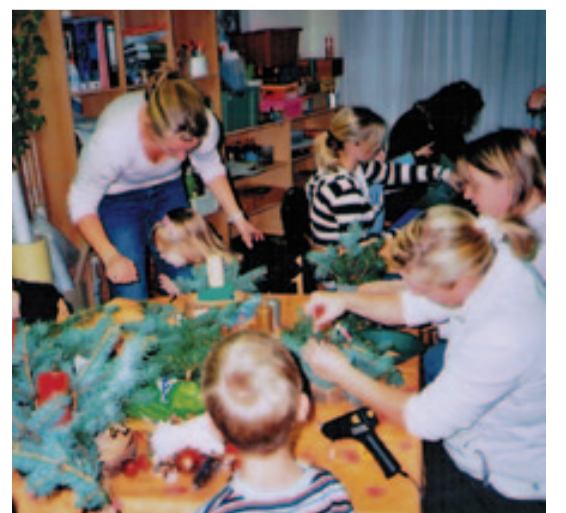
Vorfreude beim Basteln

auf die Kinder. Am 8. Dezember ist die Weihnachtsfeier in der Kita Pfannschmidtstraße. Da kommt nicht nur der Weihnachtsmann mit vielen Geschenken sondern auch noch das Puppentheater „Drunter und Drüber“ und überrascht Groß und Klein mit der märchenhaften Aufführung von „Kasper im Zauberwald“. Den Kindergarten in der Pfannschmidtstr. 70 erreichen Sie unter Telefon 94 38 11 05.