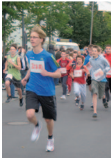
Laufen hält fit

Havemann-Oberschule konnten auf einem Parcours ein Gesundheitsdiplom erwerben. Der 6. allod-Gesundheitslauf und die dazugehörige Gesundheitsmesse in der Robert-Havemann-Oberschule sind für den 3. September 2011 geplant. Im Frühsommer soll ein Staffell-