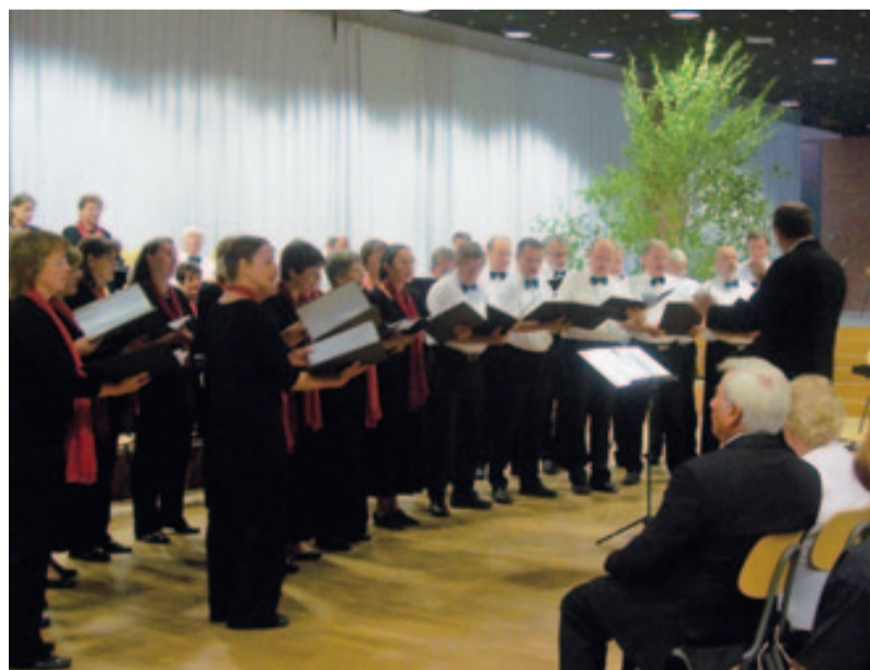
Mit Gesang den Advent begrüßen

Gerade hat der Kammerchor des Ensembles im Pankower Rathausaal mit der Musikschule ein Konzert gegeben. Diese Zusammenarbeit wird ausgebaut. Für das Frühjahr ist ein gemeinsamer Auftritt im Saal der Bezirksverordnetenversammlung geplant, bei dem auch das Rosa-Luxemburg-Gymnasium mitwirken wird. In der Weihnachtszeit gastiert der Chor am 12. Dezember um 16 Uhr wieder in der Tabor-Kirche in Berlin-Kreuzberg. Selbst auf dem Weihnachtsmarkt in Charlottenburg ist ein Auf-