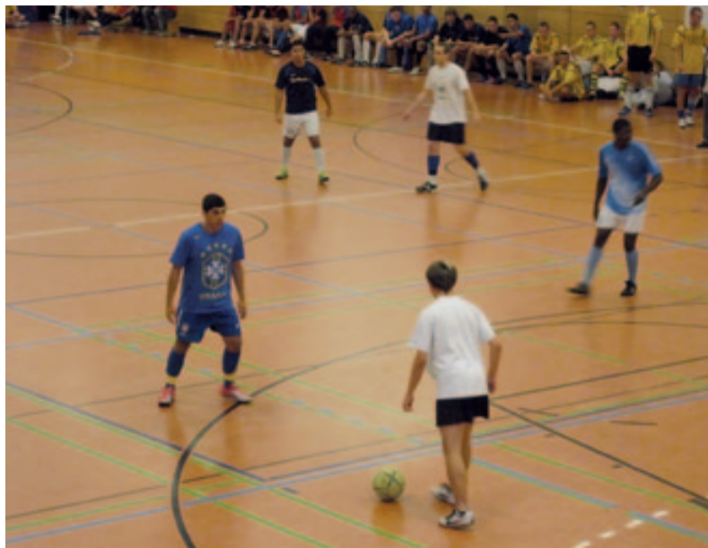
Prickelnde Wettkampfatmosphäre in der Halle

Dabei waren die Mannschaften von der Spielstärke her meist auf Augenhöhe, sodass die Finalisten erst spät am Abend ermittelt werden konnten. Die zwei erfolgreichen Teams aus Lichtenrade hatten sich im Halbfinale jeweils im 7-Meter-Schießen durchgesetzt. Den dritten Platz belegten die Gäste aus Friedrichshain, die sich trotz anfänglichem Frust über das Ausscheiden im Halbfinale dennoch über den