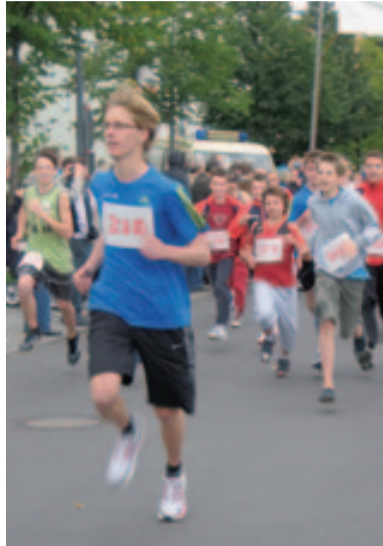
Laufen hält fit

Havemann-Oberschule konnten auf einem Parcours ein Gesundheitsdiplom erwerben. Der 6. allod-Gesundheitslauf und die dazugehörige Gesundheitsmesse in der Robert-Havemann-Oberschule sind für den 3. September 2011 geplant. Im Frühsommer soll ein Staffell-